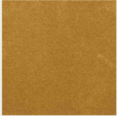
16071 ORO ROSSO