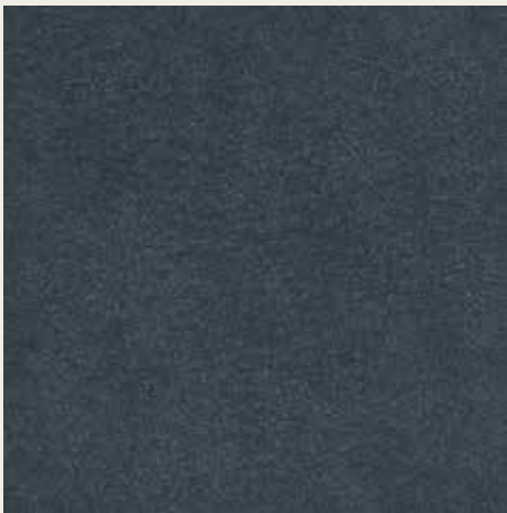
16072 ARGENTO OSSIDATO