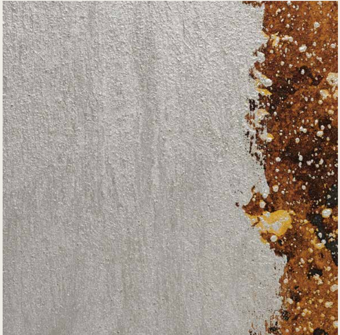
ZEUS ARGENTO + IRONIC + W2F CLEAR FINISH BI-COMPONENT GLOSSY

Für weitere Info bitte siehe technisches Merkblatt.